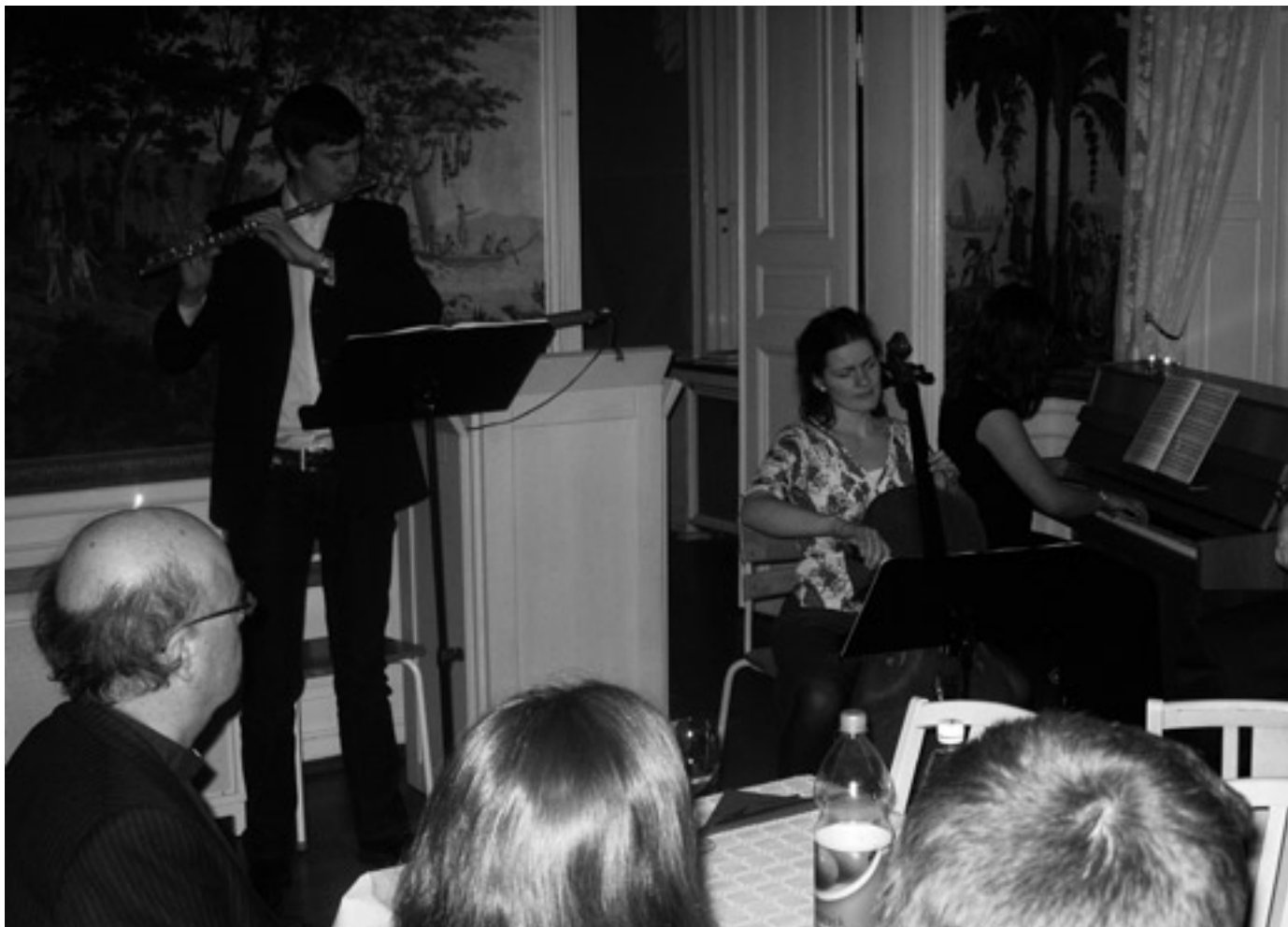
En av kvällarna arrangerade stiftelsen PIBUS en supé i LM Engströms lokaler med EAAA-teamet, styrelseledamöter och anställda.