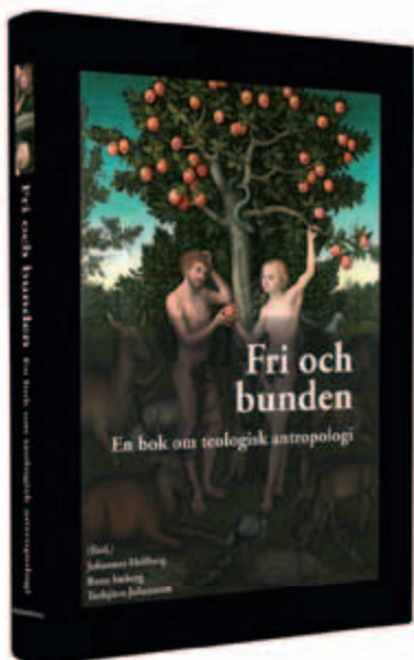
Bokutgivning – din gåva gör skillnad!

Vi väddar om generösa gåvor från våra understödjare för att Fakulteten inte ska behöva dra ner på sin verksamhet. Församlingsfakulteten behövs nu, mer än någonsin! Och ett särskilt viktigt stöd är det regelbundna gåvogivandet, att man varje månad skickar en summa. Det ger regelbundenhet i givandet och höjer på sikt våra intäkter.