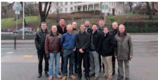
Fortbildning – din gåva gör skillnad!

Fortbildning för präster och teologer med internationell prägel. Med understöd från Nordisk Östmission kan också teologer från bl.a. Lettland delta.