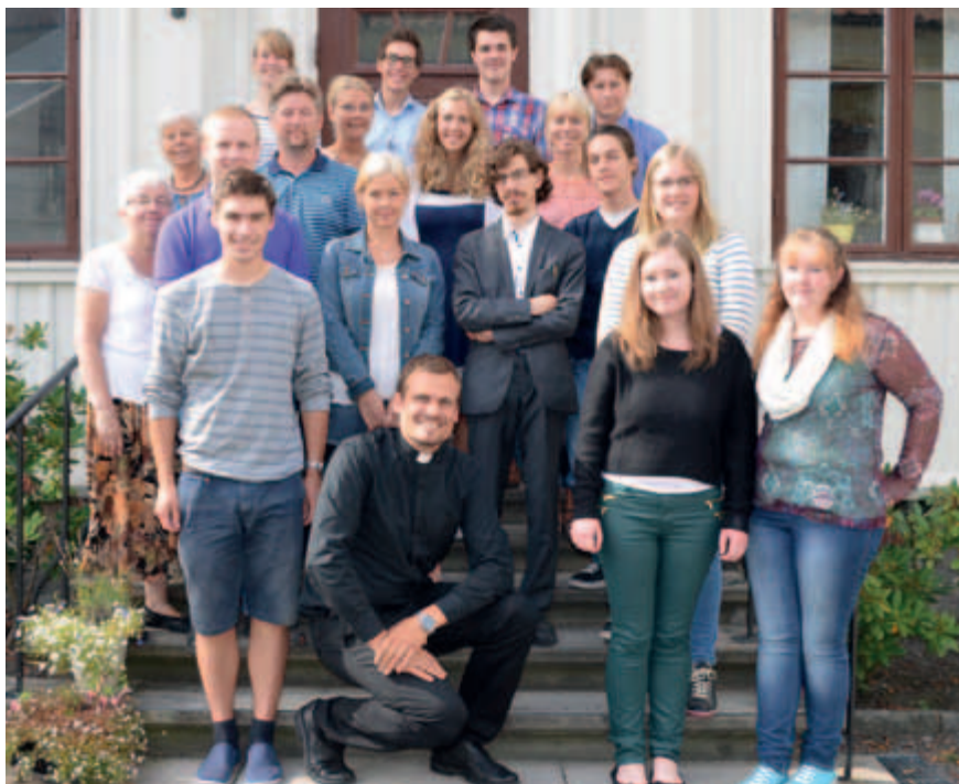
Bibelskola – din gåva gör skillnad!