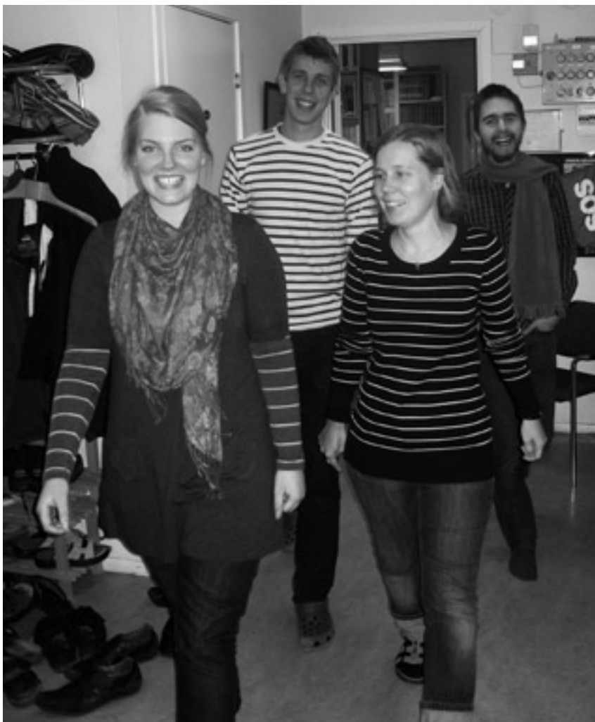
Några av "ettorna" som går på Församlingsfakulteten.

Att det är en stimulerande akademisk miljö, tycker nog merparten som upplevt den gräddvita fakulteten vid Korsvägen i Göteborg. Det blir mycket kunskap för huvudet , men får man något för hjärtat ? Med den undran ställer jag några frågor till fyra (av de tolv) studenterna i årskurs ett.