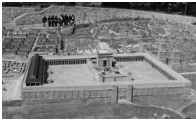
Modell över det antika Jerusalem från Israel Museum i Jerusalem, vy från öster med templet och den gyllene östra porten i förgrunden.

Hesekiels syn, där Herrens härlighet återvänder in i templet, är alltså en förebild till Messias ankomst till sitt tempel.