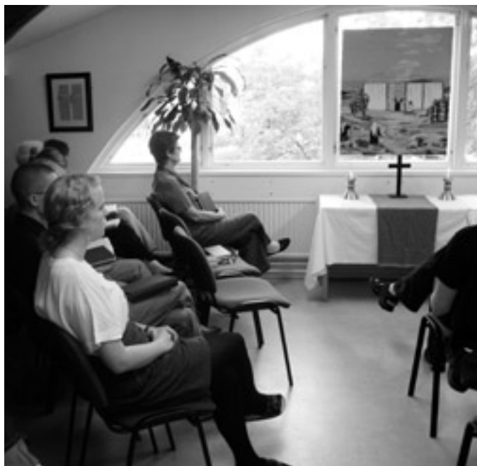
Det nya ”kapellet” i översta våningen.

Olika personligheter och bakgrund skapar också en dynamik inom elevgruppen, vilket är berikande. Mycket talar för ett gott år tillsammans, som ju också innefattar en gemensam resa till Israel, men med allt gäller orden: ”Herrens välsignelse ger rikedom, egen möda lägger inget därtill” (Ords 10:22). Det är vår bön, och vi ber också om din bön, att ”Gud öppnar en dörr för ordet, så att vi kan predika Kristi hemlighet” (Kol 4:3).