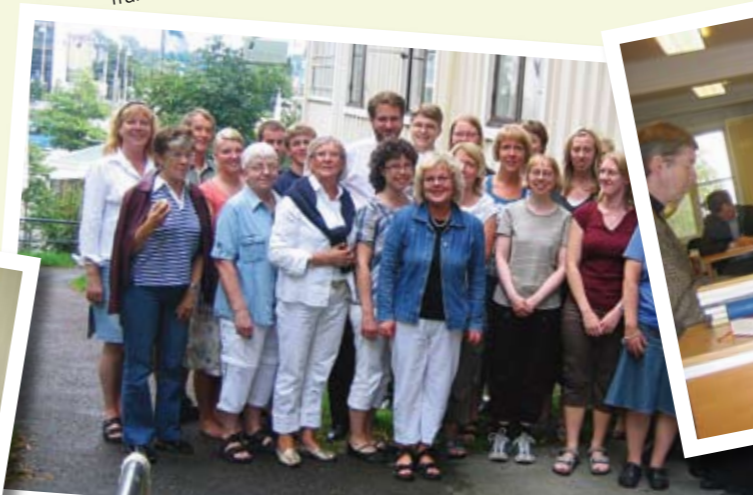
Årets "upplaga" av sommarbibelskolan