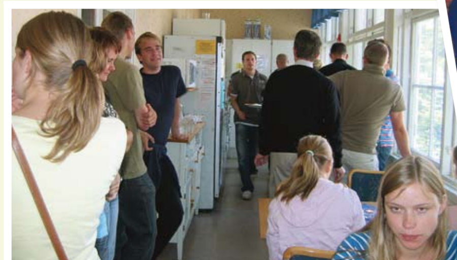
Den verkliga mötesplatsen på FFG är ofta köket