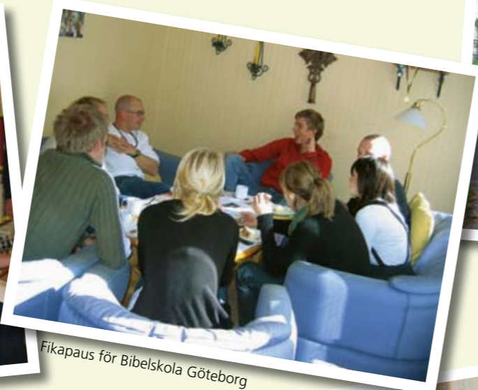
Fikapaus för Bibelskola Göteborg