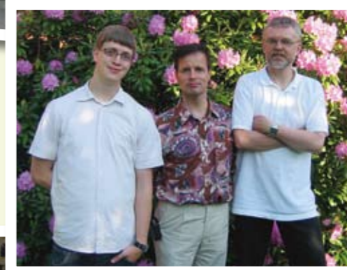
Avslutningsdag för TU 3-studenter