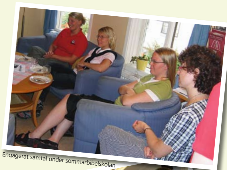
Engagerat samtal under sommarbibelskolan