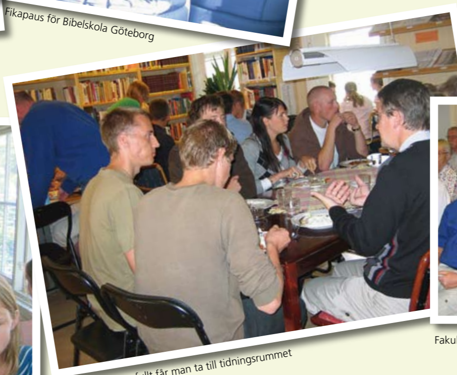
När köket är fullt får man ta till tidningsrummet