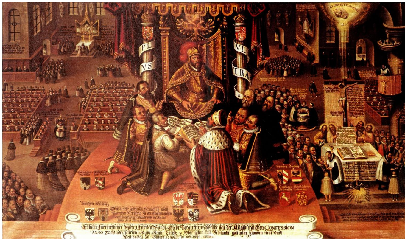
Augsburgska bekännelsen presenteras för kejsar Karl V den 25 Juni 1530. Tavlan finns i Pfarrkirche St Georg i Eisenach.

Slutligen överbryggas kursen steget mellan bekännelsen och den pastoral verkligheten. På vilket sätt spelar bekännelsen roll för gudstjänstens form och innehåll? För förkunnelsens och själavårdens mål och medel? Vad har Augsburgska bekännelsen med pastoral praxis att göra?