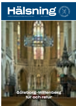
Slottskyrkan i Wittenberg

Hälsning är utgiven av Församlingsfakulteten Ekmansgatan 3 411 32 Göteborg Tel: 031-778 35 40 E-post: info@ffg.se Hemsida: www.ffg.se PlusGiro: 6 40 60-7 BankGiro: 622-5387