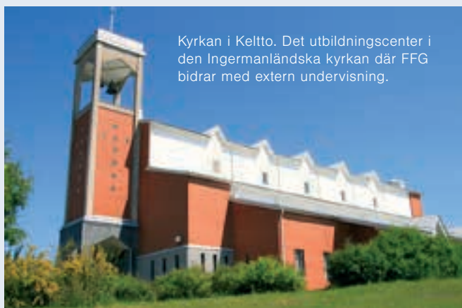
Kyrkan i Keltto. Det utbildningscenter i den Ingermanländska kyrkan där FFG bidrar med extern undervisning.