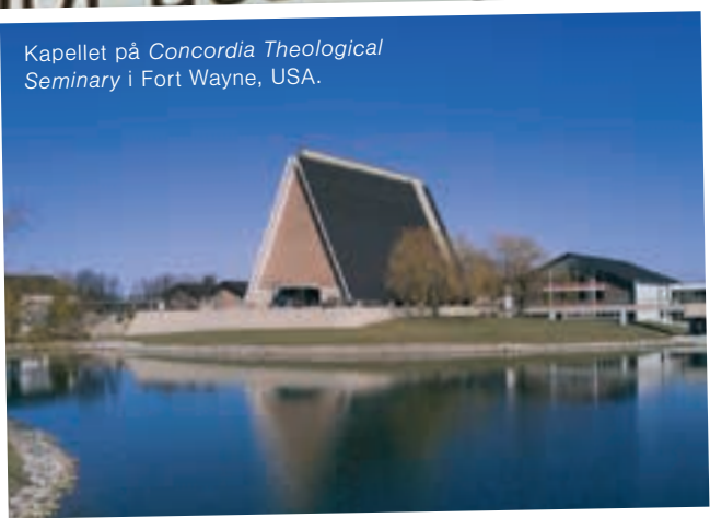
Kapellet på Concordia Theological Seminary i Fort Wayne, USA.