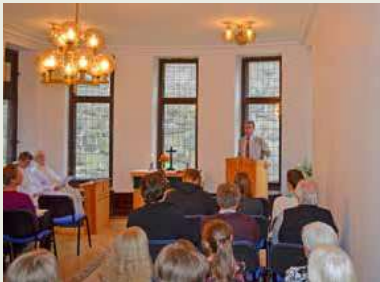
Vänster: FFGs nuvarande lokaler på Ekmansgatan 3. Höger: Kapellet i den nuvarande byggnaden där många högtidstunder firats genom åren.