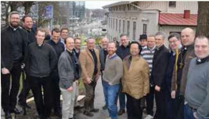
Den första STM-kursen på FFG (2014).

oss. Däremot erhöill studenterna visst studiestöd via PIBUS, och många av dem läste vidare på universitet, oftast med goda resultat. Åtskilliga har sedan utbildat sig till lärare och / eller prästvigts, inom Missionsprovinsen eller i Svenska kyrkan.