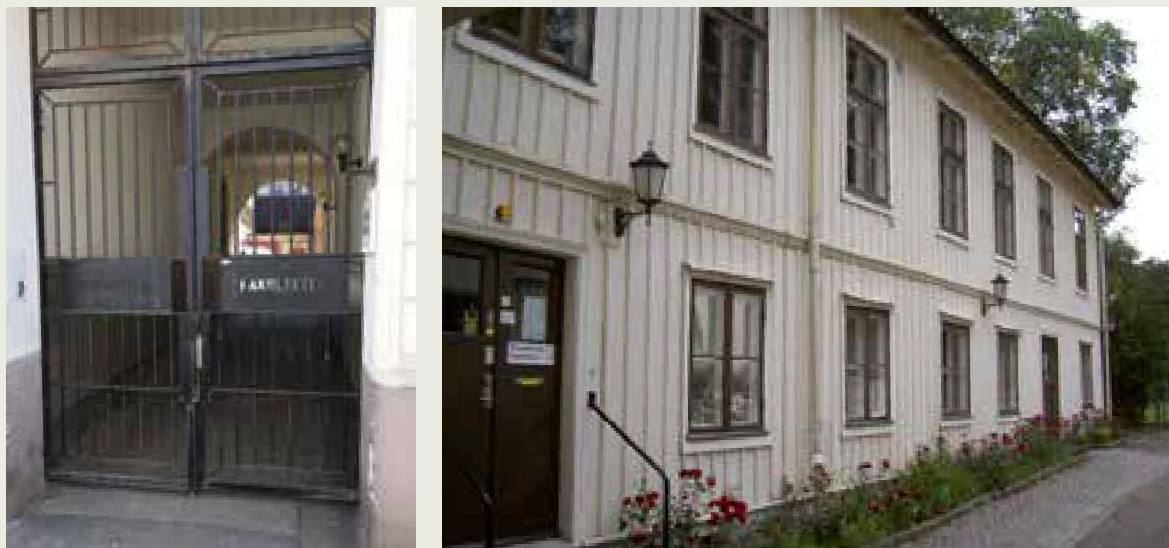
Vänster: Gamla FFG-porten på Vallgatan. Höger: FFGs lokaler på Södra vägen 61.

I samband med att gymnasiet i början på 1990-talet behövde omstruktureras, vilket även manifesterades i namnbytet, växte insikten fram att det var hög tid att växa. Kursverksamheten behövde expandera till en fristående teologisk utbildning, gymnasiet skulle alltså få en systerorganisation med samma evangelisk-lutherska profil.